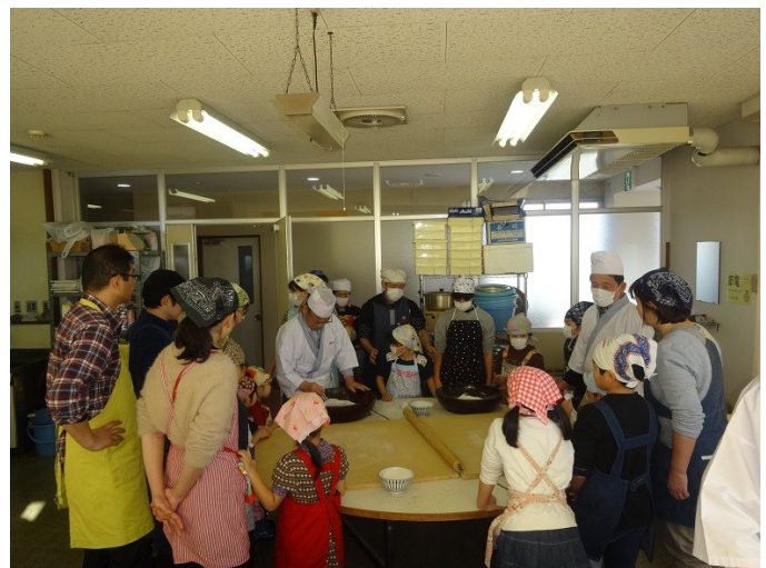
講師のそば打ちの説明を聞く参加者