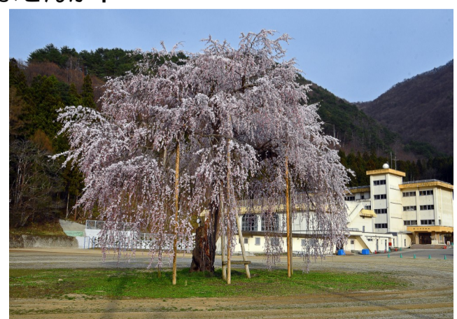
令和5年大戸町フォトコンテスト入賞作品