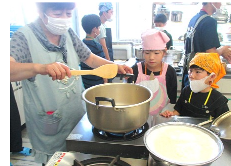
5年家庭科(和裁)支援 河東学園キッズ(ミニ運動会) 夏休み移動教室(豆腐作り)