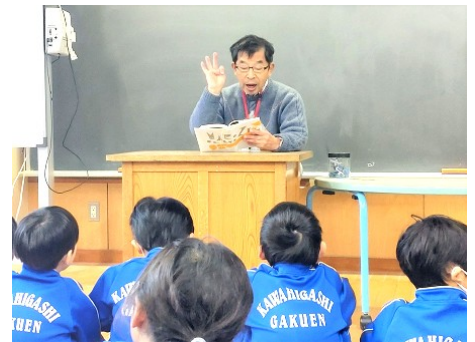
エプロン先生(1年朝の支援) 1年生活科(リース作り)支援 絵本の読み聞かせ