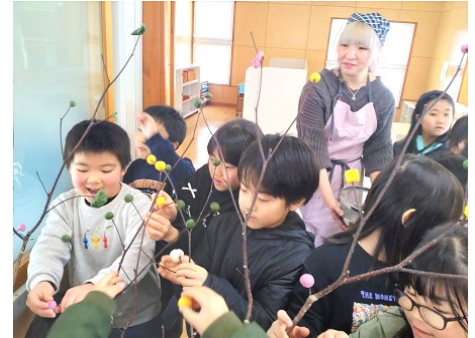
生活科(町たんけん)引率支援 1年体育科(スキー)支援 2年生活科(団子差し)支援