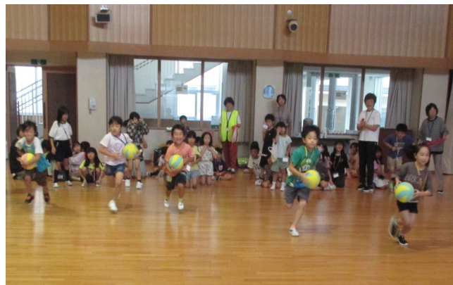
～ 放課後子ども教室 ～ 河東学園キッズの様子

子供たちの社会貢献意識、地域への愛着、コミュニケーション力及び学力の向上、そして、地域の教育力の向上、さらには活動を通じた地域の課題解決や活性化など、 子供、学校、地域 それぞれに対して様々な効果が期待できます。