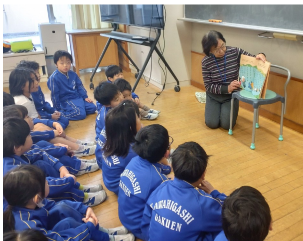
～ 読み聞かせの様子 ～