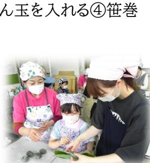
親子で協力して巻きます。