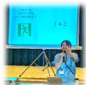
マークは何個あったかな？