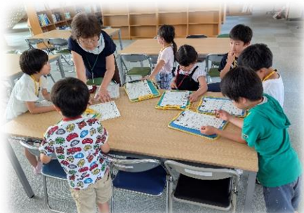
班ごとにシートを確認し探検終了です！