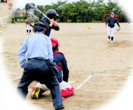
ソフトボール協会の古川会長 見事なピッチングでした！