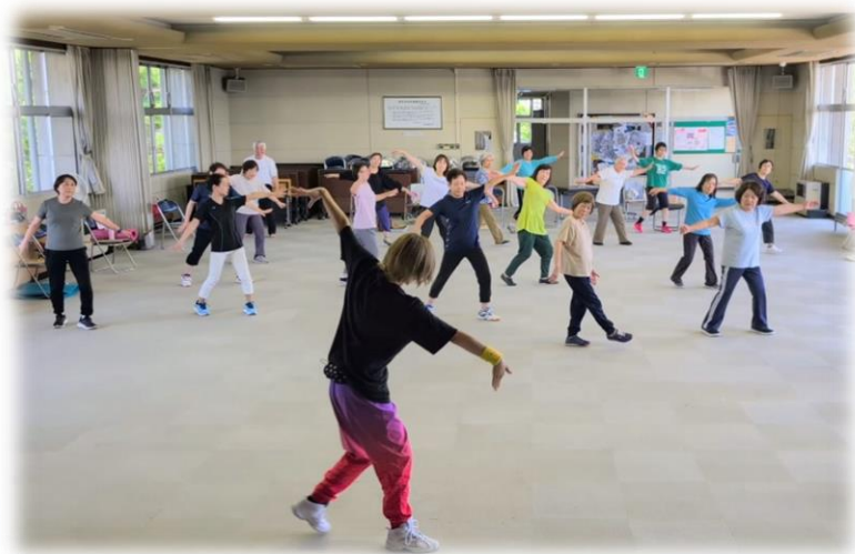
フィットネス教室の様子