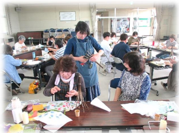
ワイヤーで固定するのが苦勞