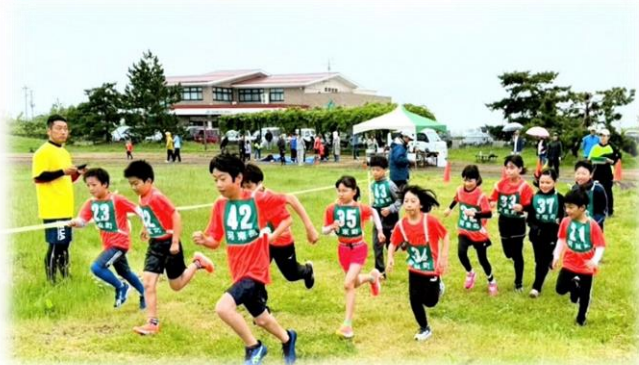
子ども達が元気にスタート！

6/1 第90回 おはよう健康マラソンデー 全8部門中7部門で30名の参加がありました。あいにくの天気で中学生以上・一般男女のスタート時には強い雨となってしまいましたが、例年並みの参加者で開催することができました！