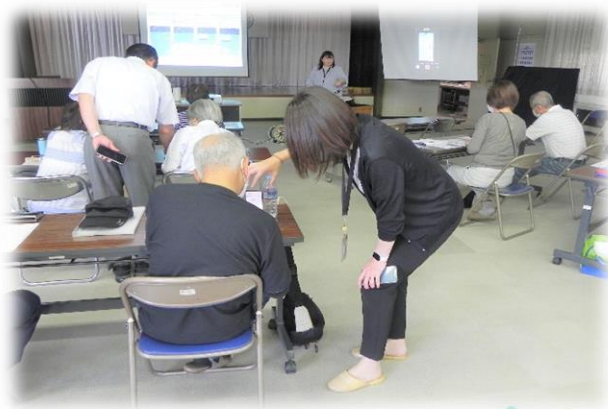
スマホの基本を学びました。