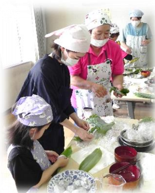
笹巻が結構難しい