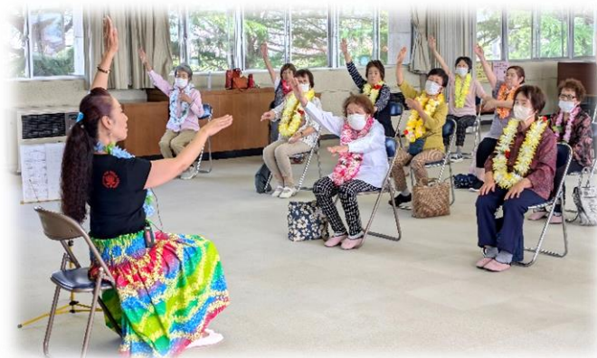
椅子に座ったままでフラダンス♪