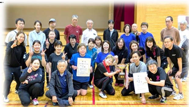
参加チーム全員で記念撮影！