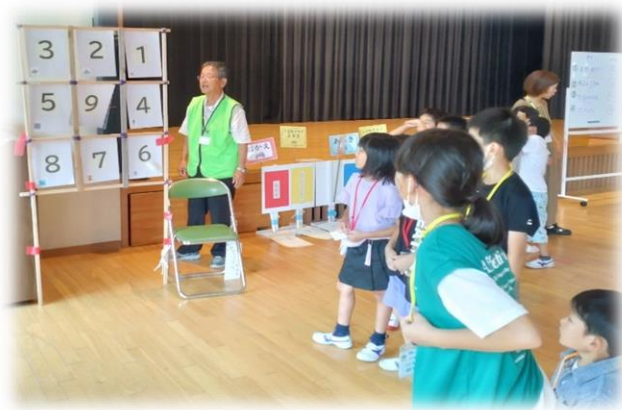
～ 学園キッズの様子 ～

子供たちの社会貢献意識、地域への愛着、コミュニケーション力及び学力の向上、そして、地域の教育力の向上、さらには活動を通じた地域の課題解決や活性化など、 子供、学校、地域 それぞれに対して様々な効果が期待できます。