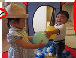
ねがいかけうたです