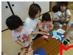
たなはた飾り製作