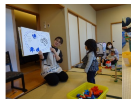
大型絵本をみたよ