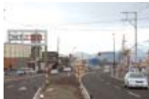
国道118号 若松西バイパス