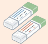
大腸がん検査容器