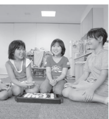
子どもたちが健やかに成長できるように、事業を進めています

市では、子どもを安心して産み・育てることができる環境をつくるため、平成17年度に「あいづわかまつこどもプラン(改訂版)・次世代育成支援行動計画」を策定しました。この計画では、「子育てをみんなで支えるまちづくり」、「子どもを安心して産み・育てることができるまちづくり」、「子どもがいいきと育つまちづくり」の3つを基本に、次代を担う子どもたちの育成と少子化対策の事業を展開しています。