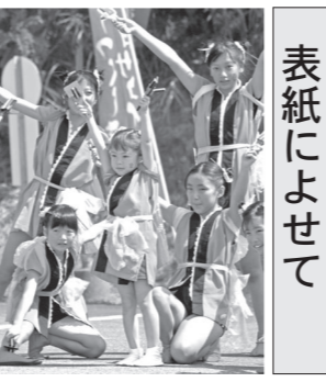
会津村と會津藩校日新館で2日にわたって開催された「つづくしまヨサコイまつりin會津」地元や県内外から多くの踊り手が集いました。両日とも、踊り手と観客が一体となって盛り上がり、会場は熱気と興奮に包まれました。(表紙は会津大学のチーム)

児童手当は、2月・6月・10月の年3回支給されます。10月期の手当は、10月10日(金)に現在の登録口座に振り込まれます。この口座の解約や名義変更がされると入金が遅れてしまいます。振り込みが済むまでは口座の解約などを行わないでください。 ◇問い合わせ…児童家庭課(☎39-1243)