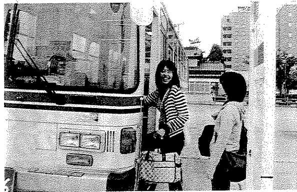
いつも車で移動する人も、たまにはバスや鉄道で移動してみませんか。いつもと違うまちの景色・雰囲気に触れられますよ