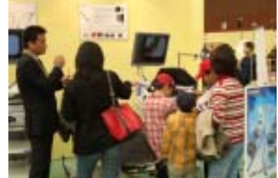
先端産業 ( 参考 ) OLYMPUS