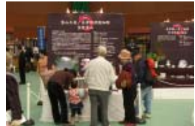
注目のこだわり工房