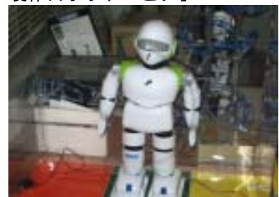
製作ロボット「ピノ」