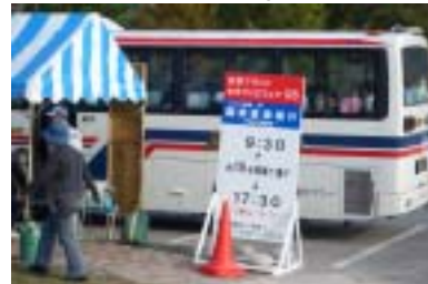
シャトルバス運行(フェア'06)