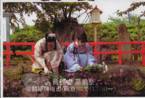
皆鶴姫 墓前祭 皆鶴姫碑周辺(藤倉)にて(13:00~)