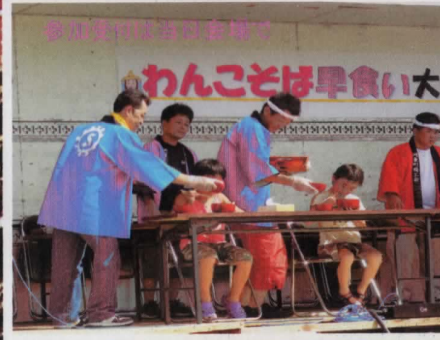
参加者が楽しむ会場