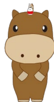
会津若松市ユニバーサルデザインキャラクター 「ゆにばくん」