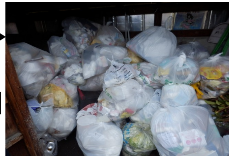
地域のごみステーション・事業所のごみ集積所

ごみステーションの生活系ごみや店舗・事務所の事業系ごみの収集が遅くなることで、衛生的な生活環境の維持や事業活動の継続に支障が生じます。