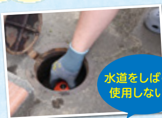
水道をしばらく使用しない時