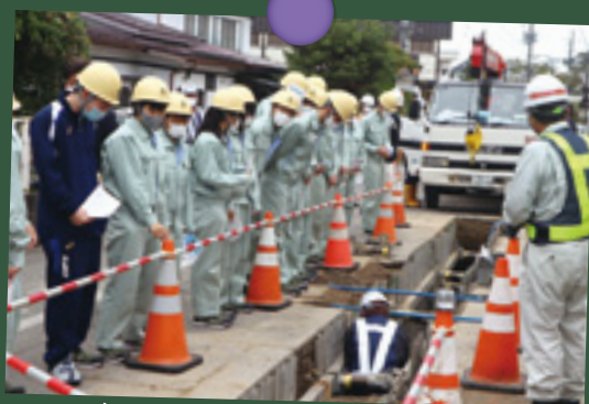
工事現場を見学する様子