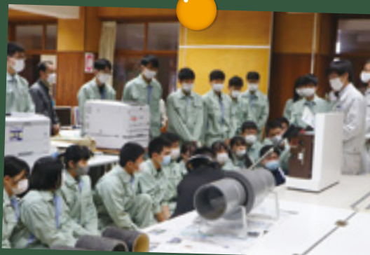
水道管の模型で学ぶ様子