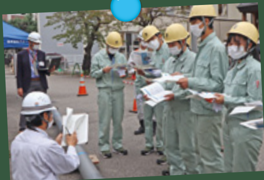
継ぎ手を確認する様子