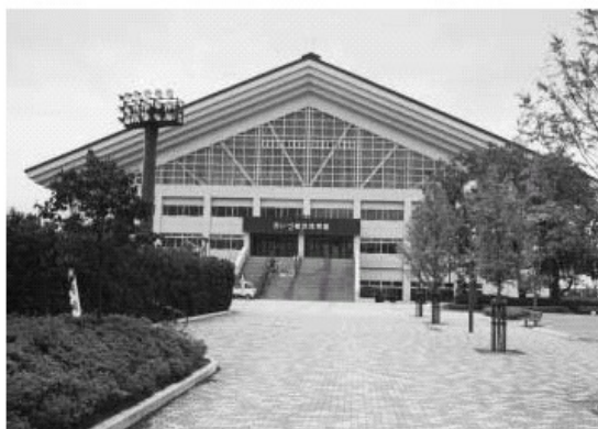
会津総合運動公園内あいづ総合体育館

あいづ球場、テニスコート、あいづ総合体育館、あいづドーム、あいづ陸上競技場、多目的広場(A・B)、サッカー・ラグビー場、ゲートボール場、あいづ相撲場、ローラースケート場、わんぱく広場、モニュメント広場、休憩広場、中央広場、プロムナード、駐車場、ふれあいの