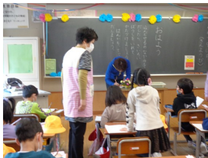
※新一年生のサポート