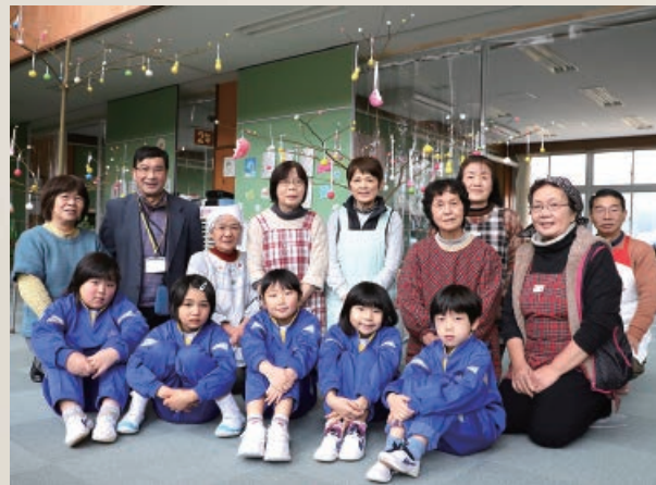
大戸地区の学校支援活動では、さまざまな学校行事を地域の皆さんが手伝ってくれます。また、地域の皆さんと子どもたちが交流できる催しも開催しています。大戸小学校では、子どもたちが地域の皆さんと一緒に、会津の伝統行事「だんごさし」を行いました(1月10日)

地域学校協働本部の役割は、学校や家庭、地域が連携しながら、地域ぐるみで子どもたちを育てていくことです。その一つに学校支援活動があります。学校支援活動では、コーディネーターが学校の要望に応じて、公民館と共に、地域の皆さんに「学校支援ボランティア」を呼び掛けるなど地域と学校とをつなぐ役割をしています。現在、大戸地区と湊地区で地域学校協働本部を立ち上げています。