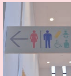
トイレのマークも、ピクトグラムの一つです

ピクトグラムとは、情報を絵や図などで表した、絵文字などの記号のことをいいます。視覚的に表現されているので、子どもや高齢者、日本語が読めない外国の人など、誰もが見てすぐに必要な情報を得ることができます。