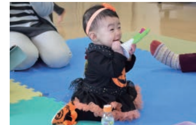
おもちゃなどを使って遊ぶこともできます。ぜひ、おいでください