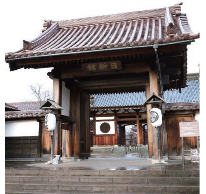
河東町南高野にある「會津藩校日新館」は、会津藩士の学び舎の日新館を復元した施設です

また、会津藩士への教育は会津以外でも行われていました。江戸詰の会津藩士やその子弟のために上屋敷には成章館が、中屋敷には考興館という藩校が設けられました。江戸時代後期になると外国船からの警備のため砲台場や陣屋が置かれた三浦半島にも、学校が置かれ会津藩士の教育が行われていました。