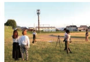
メンバー紹介動画の撮影