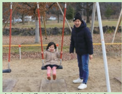
寒さに負けず、外で元気に遊びましょう

子どもたちは、生活の中でさまざまな体験をしながら成長や発達をしていきます。特に体を動かす遊びは、体の使い方を学び、少しずつ慣れない動きができるようになるためにも必要です。大人がそのことを理解し、子どもが体を動かして遊ぶ時間を作ってあげるのが大切です。そのときに気を付けることは「あれも