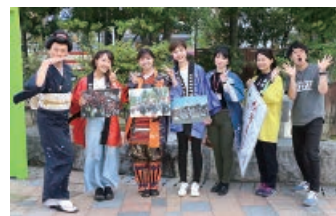
福島中央テレビに生出演