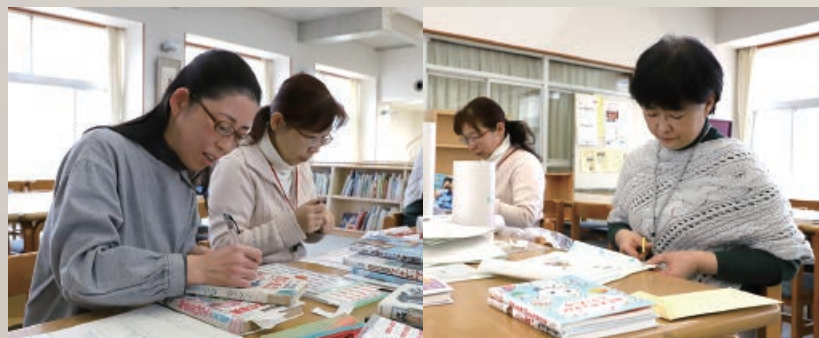
河東学園の小・中学校の図書館では、保護者の皆さんがボランティアをしています

地域の皆さんに 支えられる図書館 市立の小・中学校の図書館には、学校図書館支援員が配置されています。そのほかにも、ブックサポーターとして保護者の皆さんがボランティアで、本の修復作業をしたり、新刊のカバー掛けをしたりしている学校もあります。