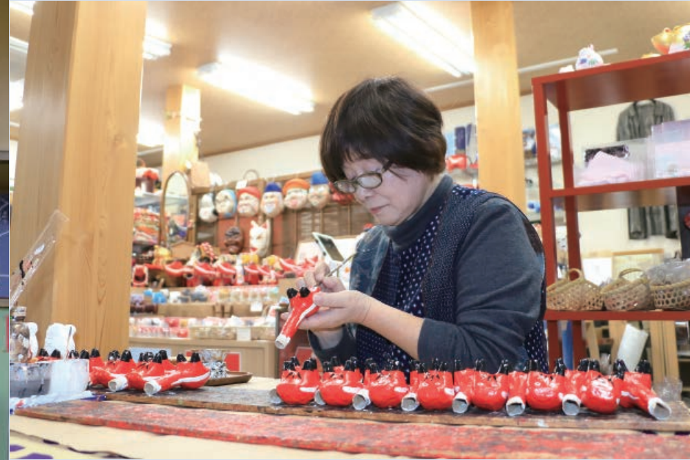
本体を作る工程から絵付けまで、全て手作業で作られています