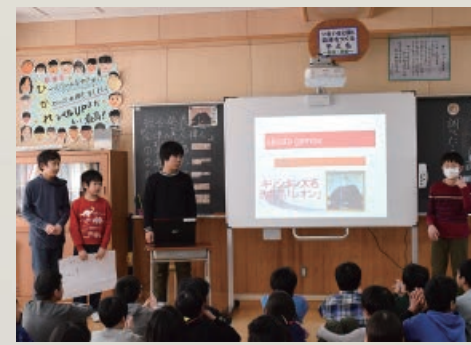
学校ごとに工夫しながら、活用しています(鶴城小学校で)

電子黒板が積極的に活用されています 市立の小・中学校では、電子黒板や指導者用デジタル教科書が各学校に配置され、外国語英語や算数(数学)をはじめ、さまざまな教科で積極的に活用されています。電子黒板や指導者用デジタル教科書は、子どもたちの学習意欲を高めています。昨年、小・中学校を対象に実施した、電子黒板の使用状況調査では、授業に効果があったとの回答が約8割に達しています。また、各学校では、避難訓練や保護者会、生徒会総会など、授業以外の学校行事でも有効活用されています。