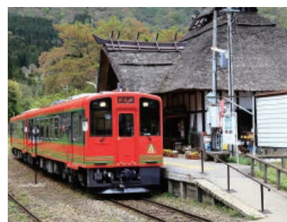
すてきな写真の投稿、お待ちしております

応募作品は、定期的に会津鉄道公式インスタグラム(@aizu_railway)に投稿します。