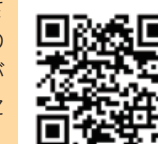
公式ユーチューブのQRコード