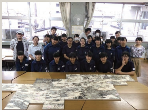
この鳥瞰図は、黒の筆ペンと二種類の太さの黒ボールペンのみで濃淡を表現し描かれています。26枚のパネルをつなぎ合わせ完成させました

戊辰戦争を通して郷土や会津の歴史を学べるような授業カリキュラムを市立の小・中学校で取り入れたり、学校給食のメニューに郷土料理を取り入れたりするなど、子どもたちが「郷土会津」への理解を深められる取り組みをしています。本年度の「あいづまちなかアートプロジェクト」では、第一中学校の美術部の皆さんがアーティストと共に「会津の鳥瞰図」を描き、自分たちの住むまちを見つめ直しました。