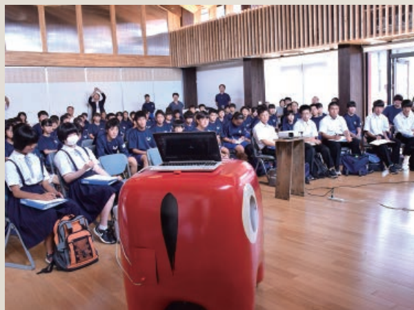
昨年9月11日、第二中学校の生徒がICTオフィス「スマートシティAiCT」の見学会に参加しました。オフィス棟の見学のほか、交流棟で入居企業の仕事の説明を聞きました

学校・家庭・地域が共通理解のもと、連携していくために、地域に開かれた学校づくりの取り組みとして、「あいづっこweb」や「あいづっこ+」などのICTを活用した情報の発信を行っています。さらには、昨年4月に開所したICTオフィス「スマートシティAiCT」を見学する機会を設けるなど、子どもたちがICTをより身近に感じられるような、キャリア教育にも取り組んでいます。