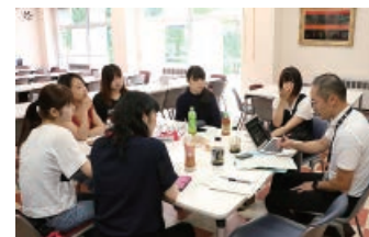
CM大賞の応募作品の打ち合わせ