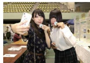
環境フェスタでSNS配信