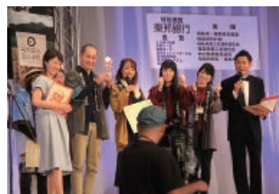
福島放送の公開収録参加

▼福島放送の「ふくしまの元気！応援CM大賞」の公開収録に参加しました。AiZ'Sモーションが企画し出演したCMは、福島県町村会会長賞を受賞しました