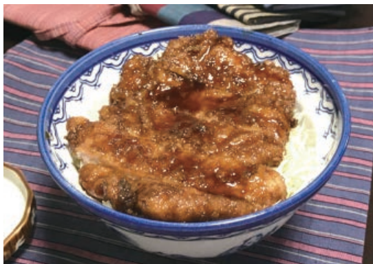
地域おこし協力隊が飲食店と連携し、会津木綿のランチyonマット付きメニューを企画しました(白孔雀食堂で)

地域おこし協力隊は、移住者の新たな視点から、本市の魅力を発見し再認識することにもつながる制度で、今後の地域づくりにも役立てていくことができます。今後は、他自治体の事例を参考にしながらさまざまな分野で活躍できるような活用方法の検討を進めていきます。