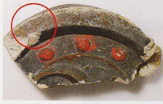
金箔の残る瓦(赤丸囲い部分)。赤く塗られているのは漆で、この部分にも金箔があった可能性があります

今回で5回目となった散策会。出発前に受け取った巻物の中に7つの謎が書いてありました。御廟の成り立ちや歴史、会津武家屋敷にちなんだ謎です。散策を始める、あちこちに解説板が置いてあり、そこで「きふくん」が答えのヒントをくれます。こうして、御廟に登った後には、会津武家屋敷に向かいます。武家屋敷を探検しながら、また謎に答えて、ゴールです。 ゴールでは、「仕の掟」が書かれた記念品を受け取り、会津の歴史を楽しむ1日となりました。