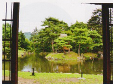
右)庭園南東部分から眺めた御茶屋御殿 上)御殿から眺めると庭園の景観を存分に楽しむことができます