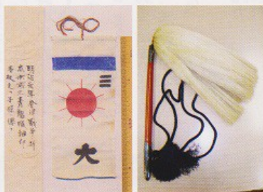
会津藩で使用されていた「采配」(右)と年齢別に編成された会津藩軍隊の1つ「青龍隊」の袖印(左)。 会津藩士のご子孫から寄贈を受けました