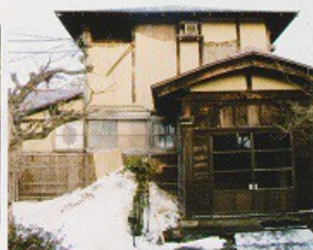
上)震災時の御茶屋御殿玄関部分も含め、明治期の増築と考えられます