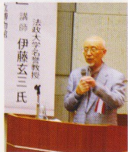
講演では、大塚山の埋葬者像にも迫りました

10月13日 福島県立博物館 一箕町にある国史跡の前方便 円墳。その歴史に迫りました