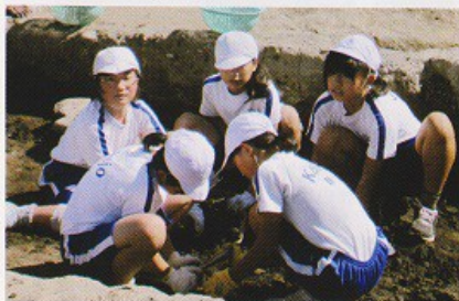
上) 「この場所に体育館があったよね」思い出を振り返りながら、掘り進めます