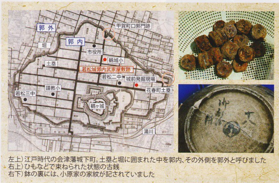
左上) 江戸時代の会津藩城下町。土塁と堀に囲まれた中を郭内、その外側を郭外と呼びました 右上) ひもなどで束ねられた状態の古銭 右下) 鉢の裏には、小原家の家紋が記されていました