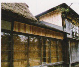
上)応急工事による壁の補修 左上)震災時の御殿内部 左)御殿前は、憩いの場となっています