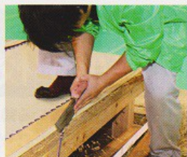
上)浮世絵木版画を彫り、色刷りする技術の披露 右下)神社のお社で神様が座られる伝統的な畳の製作 左下)川南小彼岸獅子クラブによる獅子舞

文化財を守るためには、伝統的な修理方法や道具・材料を作る技術も守る必要があります。文化庁では、「その技を「選定保存技術」として選定しています。普段は目にすることのない熟練の技術。先人から受け継がれてきた、貴重な技です。当日は、29団体が一堂に会し、その技を披露しました。本市からは、かんしょ踊り（かんしょ踊り保存会）、白虎隊剣舞（若松第一幼稚園）、小松彼岸獅子舞（川南小）を披露しました。