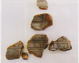
梵鐘を作るための鑄型の破片。土製で、鐘の文様となる線が彫られています

お椀や皿などの陶磁器、漆器や井戸の滑車、筆と墨壺を組み合わせた筆記用具である矢立、銭など当時の生活の様子を物語る出土品がありました。なかには、上級武士の暮らしぶりをうかがわせる茶器などもあります。このほか、武家屋敷では使用されない金箔の瓦が出土し、なぜここから出土したのか、検討が待たれます。