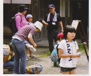
今回は、御廟の後に「会津武家屋敷」まで散策しながら、謎解きを楽しみました

今回で5回目となった散策会。出発前に受け取った巻物の中に7つの謎が書いてありました。御廟の成り立ちや歴史、会津武家屋敷にちなんだ謎です。散策を始める、あちこちに解説板が置いてあり、そこで「きふくん」が答えのヒントをくれます。こうして、御廟に登った後には、会津武家屋敷に向かいます。武家屋敷を探検しながら、また謎に答えて、ゴールです。 ゴールでは、「仕の掟」が書かれた記念品を受け取り、会津の歴史を楽しむ1日となりました。