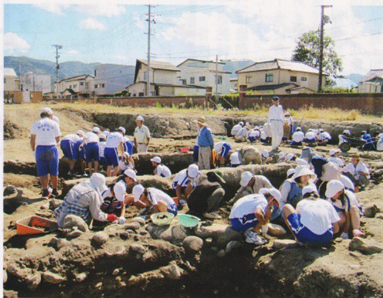
上) 2時間の体験でもたくさん瓦が出てきました

発掘調査が進む10月には鶴城小6年生が体験学習に訪れました。学び舎の発掘に、最初は緊張気味でしたが、土器や瓦が見つかるたびに、にぎやかな歓声が上がりました。