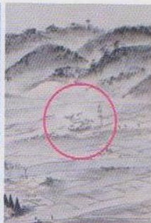
江戸時代の石部桜