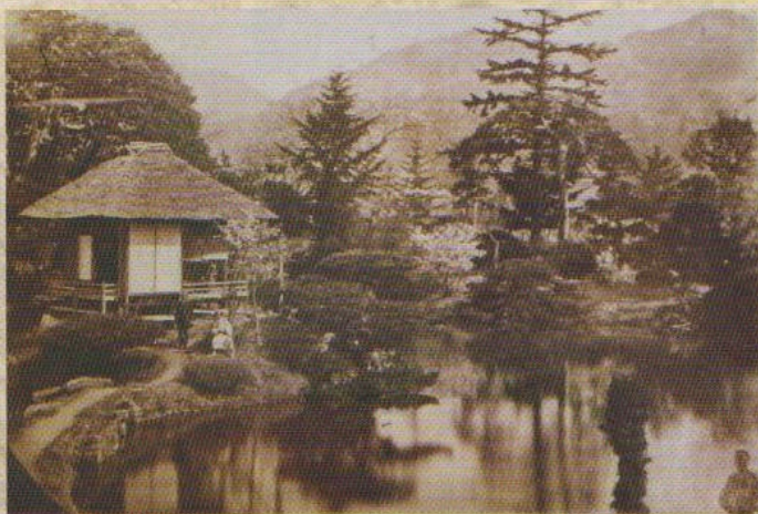
(上)御薬園 (中)飯盛山・白虎隊士の墓 (下右)磐梯山 (下左)東山温泉