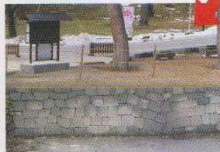
江戸時代の石積技法により修復