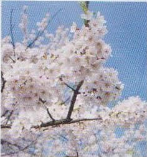
いち早く花が咲くといわれ会津に春の訪れを告げる

時代を経て愛されてきた桜。この桜がこれからも長生きしていくためには、成長の源である根元を踏み固めないことが必要です。そこで、新しい木道や柵を設けて、桜の成長をさまたげることなく鑑賞できるようにしました。きれいな桜が咲く頃には、新しい説明板もできています。これからも美しい桜が咲き続けるよう、見守りたいものです。