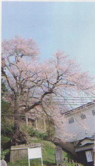
樹高約13メートル、枝張り約17メートル、樹齢約300年のエドヒガン 優雅な枝張りを見せている

急な地形に根を張ってまっすぐに立ち上がり、花を開く様子は圧倒的な美しさとなります。この桜の立つ急斜面では、根元の土が流出したり、周りの樹木で日光が遮られたりするために、だんだん桜に衰えが見られるようになりました。そこで、枝を支える柱を立て、周りの環境を整えて、桜の生育が回復するよう取り組みました。 石部桜とともに会津二代老樹と称されている大夫桜。言い伝えとともに守られている桜です。