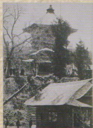
(上右)さざえ堂 (上中)さざえ堂の裏書き (上左)鶴ヶ城の裏書き (左)磐梯山裏書き

写真の裏には、八重自身によるものと思われる墨書が残されています。そこには、撮影されている名所の場所や「新島」の名が記され、大切に保管していたことがわかります。時折、写真を眺めながら、遠いふるさと「会津」を懐かしむ八重の姿が浮かんでくるようです。