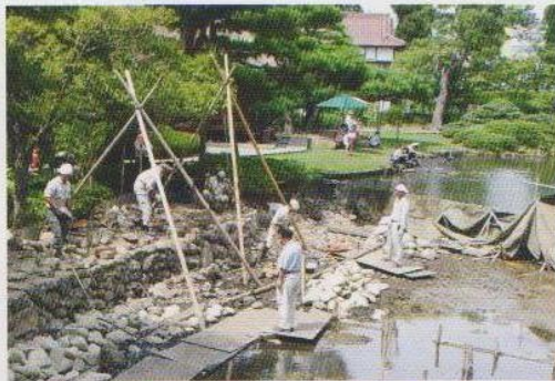
文化財庭園を江戸時代さながらの伝統技術で修復