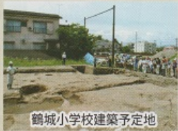
鶴城小学校建築予定地

昨年7月6日、調査員より、発掘調査現場や出土遺物について説明をしました。中でも注目を浴びたのは、天目茶碗や織部・志野の向付といった茶道具の他に、説明会の1週間前に偶然見つかった金箔瓦でした。光に反射して輝きを放つその姿は、展示した遺物の中でも特に際立っていました。約100名の方々に参加いただきました。