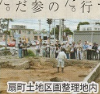
扇町土地区画整理地内