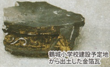
鶴城小学校建設予定地から出土した金箔瓦