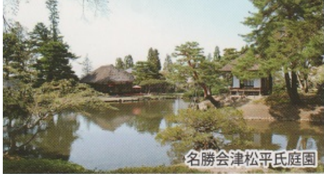
名勝会津松平氏庭園