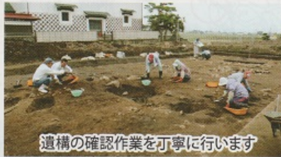
遺構の確認作業を丁寧にしています

この地点は本来、今よりも高い地形で、後の時代に土地を削って家を建てたり、耕作に利用したものと考えられ、役所に係する施設の中心は、これより北の集落内に存在すると考えられます。