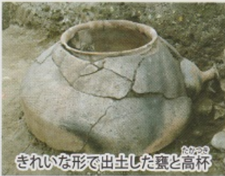
きれいな形で出土した甕と高杯