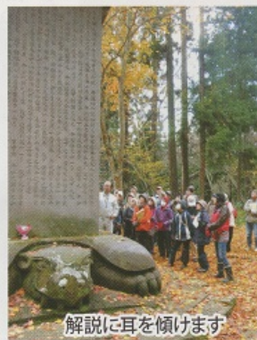
解説に耳を傾けます