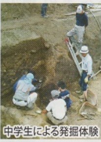
中学生による発掘体験