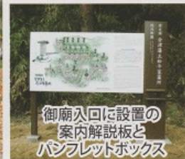
御廟入りに設置の案内解説板とパンフレットボックス