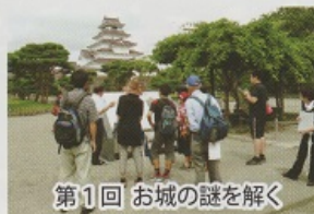
第1回 お城の謎を解く

今年も楽しく歴史や文化にふれることをモットーに学習講座やワークショップを開催する予定です。たくさんのご参加をお待ちしています。 昨年8月と11月に、まなべこを起点とした学習講座「不思議発見！鶴ヶ城へ行こう」を開催しました。普段何気なく見ている鶴ヶ城の石垣。今から400年以上前に積まれたものも現存しています。積み方の解説などを通して、今までとは違った視点で散策していただきました。また、本年3月には会津の年中行事を描いた絵の鑑賞会と香り袋作りを行いました。