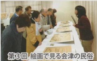
第3回 絵画で見る会津の民俗

まなべこでは、会津の昔を知ることができる古写真を集めています。お譲りいただける方の情報をお待ちしています。(電話:27-2705)