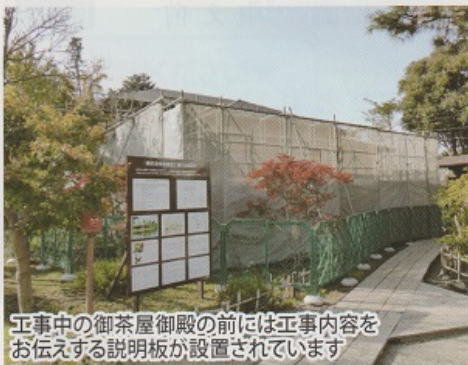
工事中の御茶屋御殿の前には工事内容をお伝えする説明板が設置されています

震災の影響と長年の使用により傷みが目立ちますが文化財に指定されている建物ですので、現在使われている部材をできるだけ使用しながら修復しています。明治期の建物の工事は平