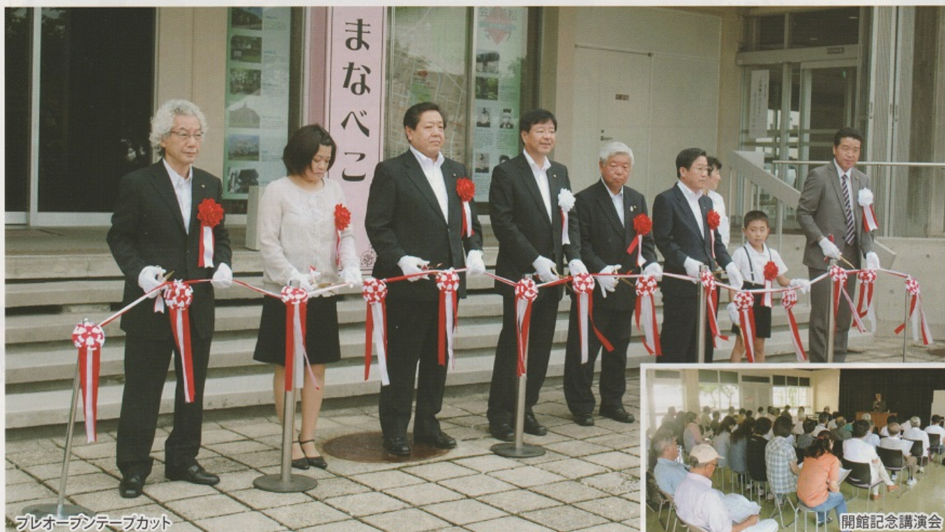
プレオープンテープカット