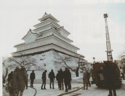
梯子車は天守閣の最上階まで届きます