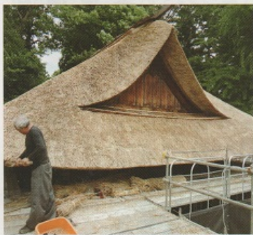
職人さんが手作業で形を整えます

平成26年1月から実施されていた、河東町冬木沢の国指定重要文化財八葉寺阿弥陀堂の屋根の葺き替え工事が終了しました。美しい曲線を描く黄金色の屋根が眩しく輝いています。