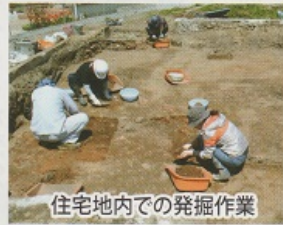
住宅地内での発掘作業

調査では、窯本体の位置や構造は確認できませんでしたが、窯の一部である壁やレンガの破片、溶けたり重くなったままの陶磁器の破片や窯で焼く際に使われた道具類が大量に出土しており、調査場所の周辺に窯があったことが確認できました。