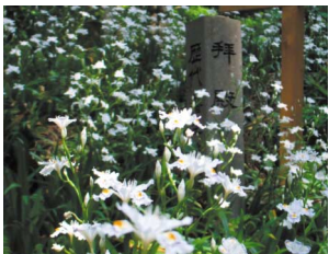
シヤガの群生(初夏)

春の訪れとともに響くキツツキの巣作りの音。初夏に咲き誇るシヤガの群生。匂い立つほどに深い緑の夏。落ち葉の音が楽しい秋。静寂な白い世界を作る冬。四季を通じて移ろいでいく情景をお楽しみください。