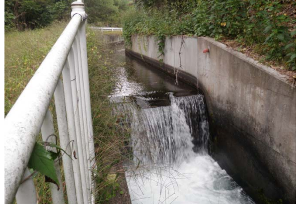
発電候補地点の落差工（近景）