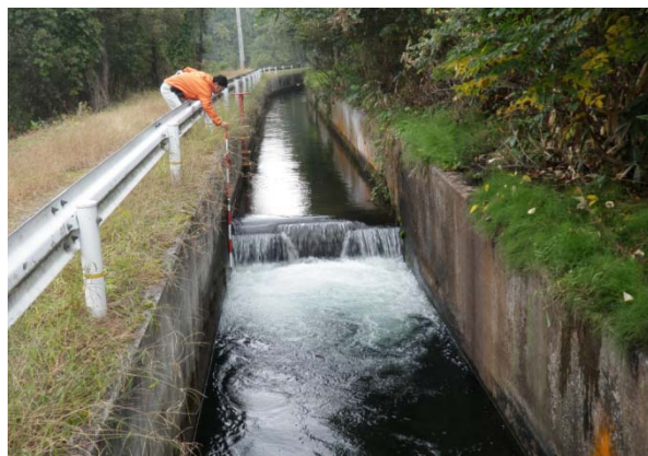
その他近接する落差工（低落差）