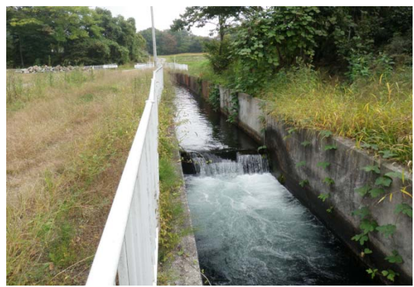
その他近接する落差工（低落差）