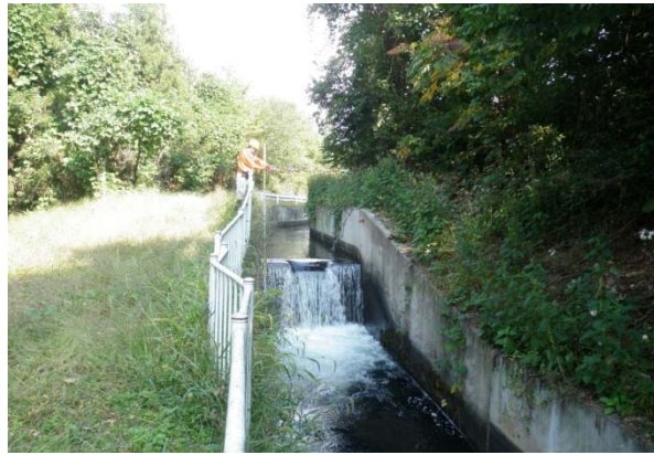
発電候補地点の落差工（全景）