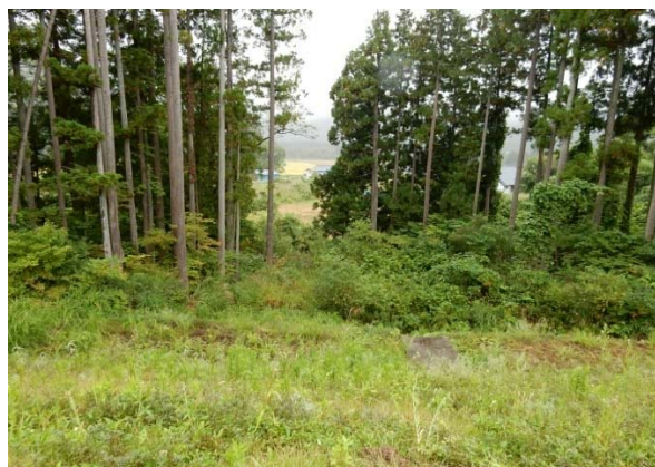
ため池の排水部（下流に小水路が続く）