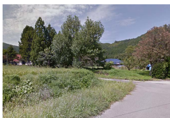
ため池周辺の集落状況