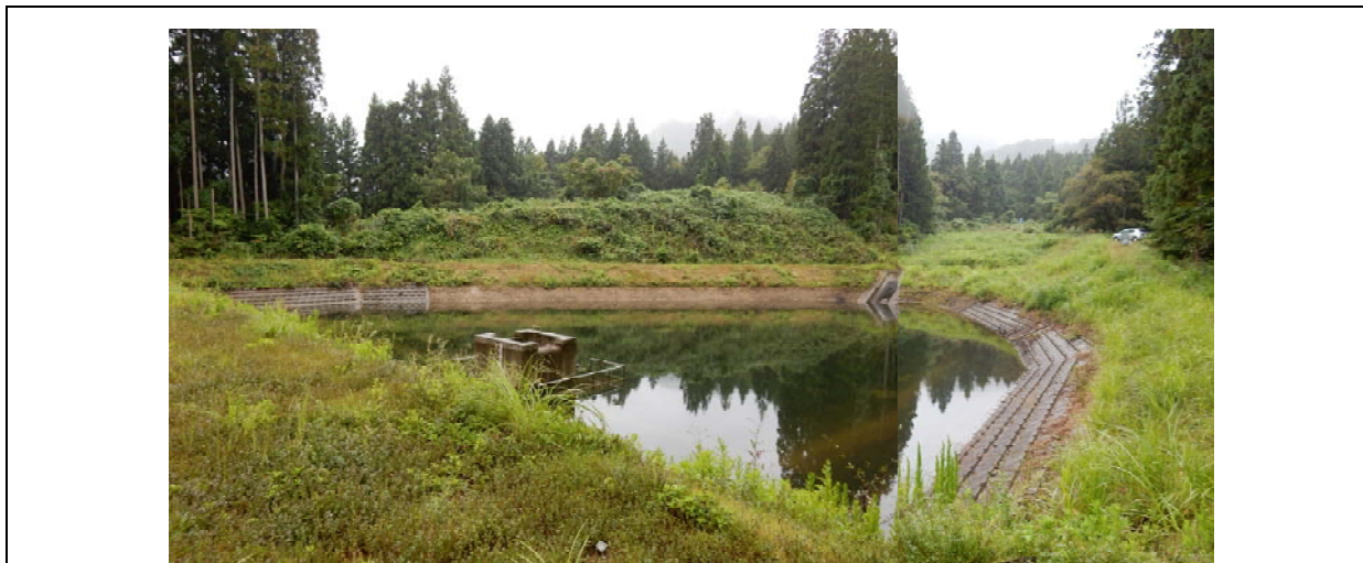
小谷原ため池の全景